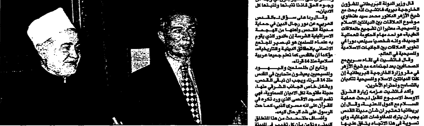
شيخ الازهر وديوبند فانشتيت خلال المؤتمر الصحفي أمس بقرى وزارة الخارجية

شيخ الازهر: القدس اسلامية عربية منذ 14 قرنا ويجب ان تبقى كذلك